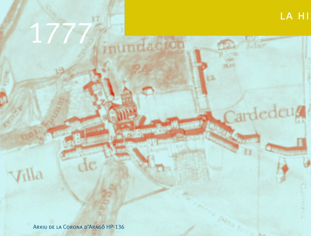
ARXIU DE LA CORONA D'ARAGÓ HP-136

El municipi de Cardedeu està situat al centre de la depressió del Vallès, a la part baixa de la riera de Cànoves que travessa el terme.